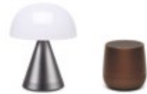
Mina & Mino 30 €